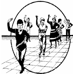
Sinh Hoạt Dành Cho Người Cao Niên