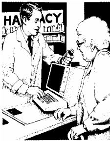
Dịch Vụ Sức Khỏe

Cơ hội được tiếp xúc riêng-từng-người-một với những chuyên viên thuộc các cơ quan chính phủ và các tổ chức tư nhân trong nhiều lãnh vực khác nhau